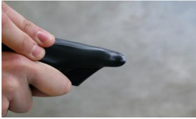
Manchons latex exposé aux angles.