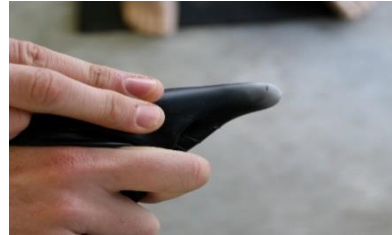
Manchons silicone exposé aux angles.

Combinaison étanche avec fermeture dorsale, la plus courante puisque la plongée est généralement pratiquée en binôme.